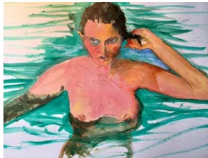
© Bruno Grocolas « Main Gauche », 40x30 cm

Une immersion poignante dans la culture haïtienne, entre beauté et chaos. Je raconte l'attachement à une famille chaleureuse, la résilience d'un peuple, et une spiritualité riche. Malgré l'insécurité, le racisme envers les blancs et la violence ambiante, j'explore une culture vaudou fascinante, aussi déstabilisante qu'enrichissante.