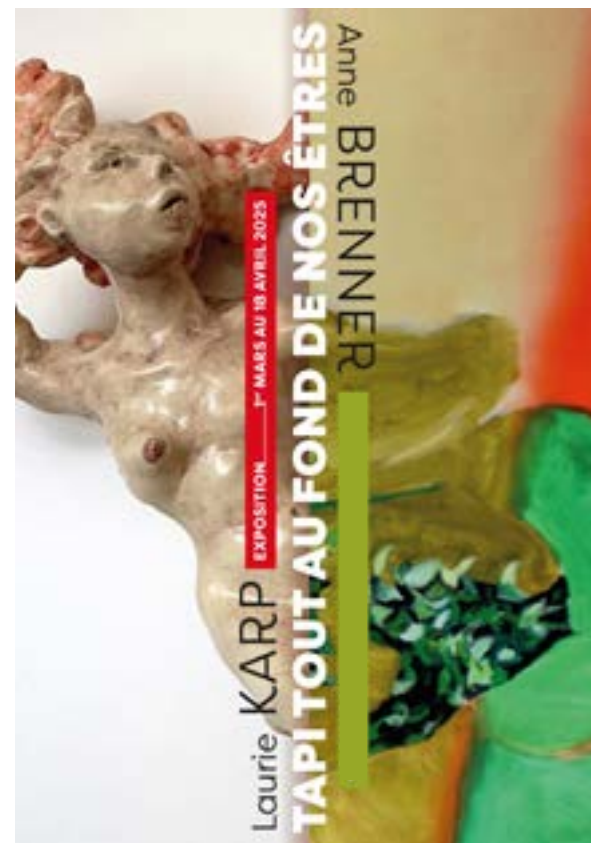
Dans le cadre de l'exposition « Tapi tout au fond de nos êtres »

EDITH Auto-stop, covoiturage, blabla-car